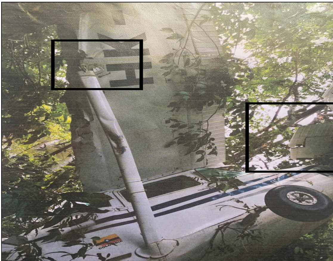
Fotografía No. 2: Daños en las superficies de control.

SUSTANCIALES. Como consecuencia de la colisión contra el terreno, la aeronave sufrió daños importantes en la planta motriz, desprendimiento del timón de profundidad, ruptura de los montantes de los planos, doblamiento del plexiglás frontal, daño estructural de la aeronave, así como en todas las superficies de controles de vuelo.