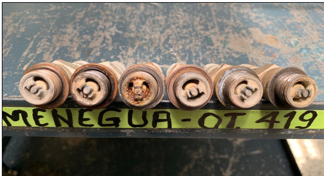
Fotografía No. 5 – Condición de seis (6) de las ocho (8) bujías instaladas.

El taller Reavi Ltda., es un taller autorizado para ejecutar mantenimiento de línea, servicios de 50, 100, 200 o 1500 horas, así como los servicios exigidos por la Autoridad de Aviación Civil; sin embargo, no se evidenció un proceso efectivo de inspección de los trabajos por parte del AIT, para reportar condiciones no comunes en las aeronaves y sus componentes.