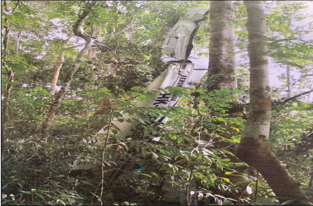
Fotografía No. 3: Daños en el cono de cola y superficies de control.