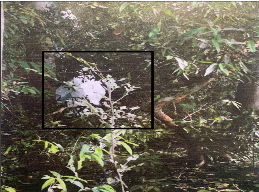
Fotografía No. 4 – Ubicación de los restos según la posición final de la aeronave

Como consecuencia del impacto vertical con los árboles, las superficies de control se desprendieron de la aeronave.