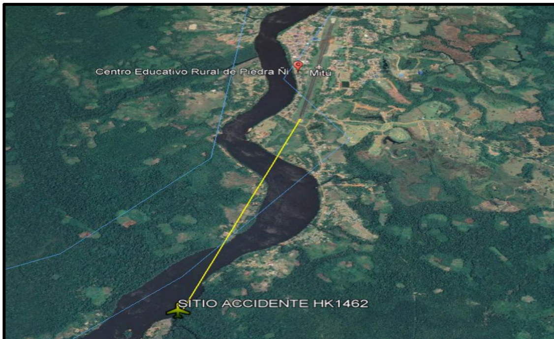
Gráfica No. 2: Ubicación final del HK1462