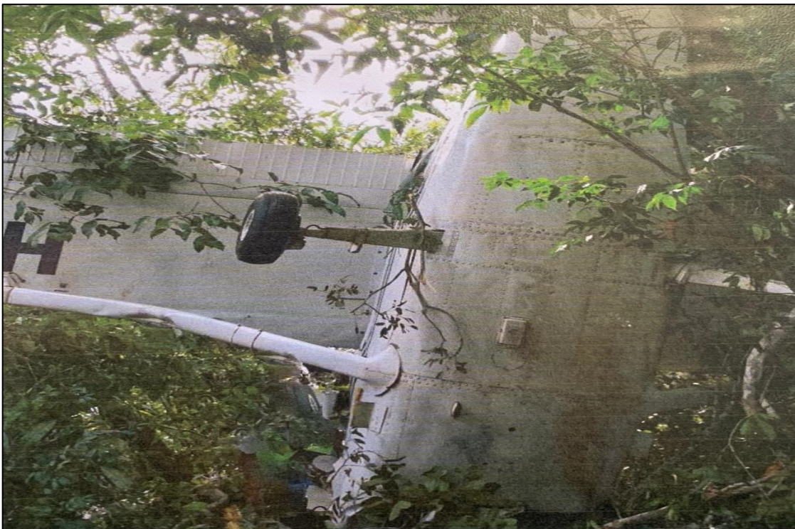
Fotografía No. 1: Posición final de la aeronave HK1462

La investigación emitió tres (3) recomendaciones de seguridad operacional, dirigidas dos (2) de ellas al taxi Aéreo Altos de Menegua y una (1) a la Aeronáutica Civil.